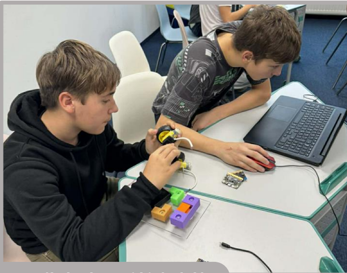
7. osztály budapesti kirándulása