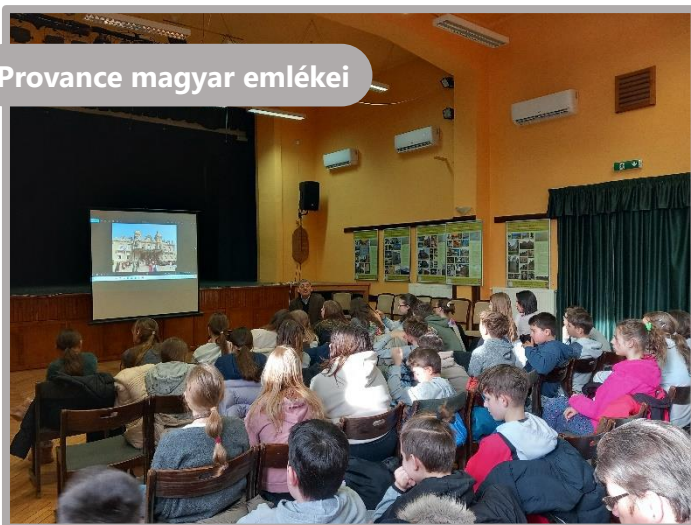
Provance magyar emlékei