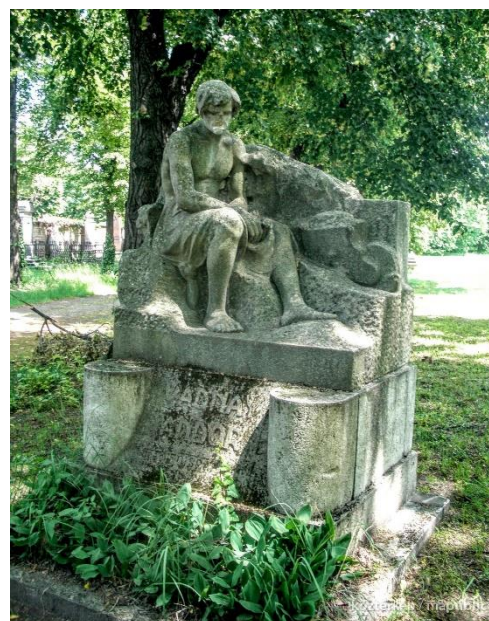
(a Kallós Ede és Márkus Géza alkotta síremlék.)