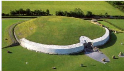
Newgrange – öregebb a piramisoknál

Krisztus előtt 7900 körül érkeztek meg az első vadászó-gyűjtögető népcsoportok a szigetre. Néhány ezer évig nem igazán történik semmi jelentős. 5000 évvel ezelőtt aztán ezen emberek leszármazottai megépítik Newgrange-et, a ma a világörökség részét képező 90 méter átmérőjű, 10 méter magas újkőkori sírdombot és a környék többi emlékét. Igaz, a helyiek szerint a Tuatha Dé Danann, azaz Danu istennő népe alkotta, akik a föld alatt élt mítikus törzs voltak.