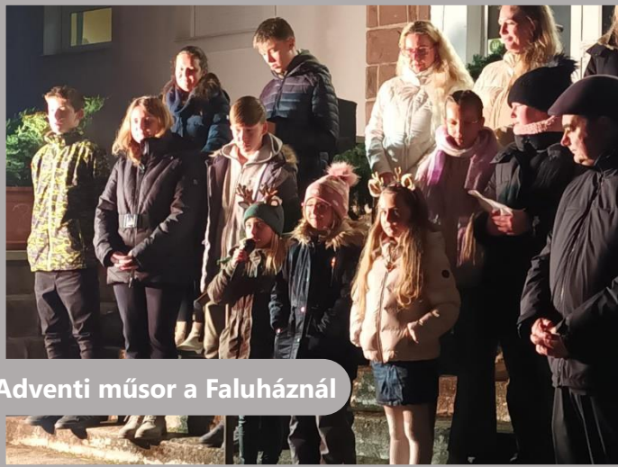
Adventi műsor a Faluháznál