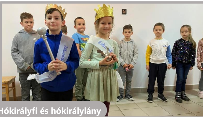
Hókirályfi és hókirálynő