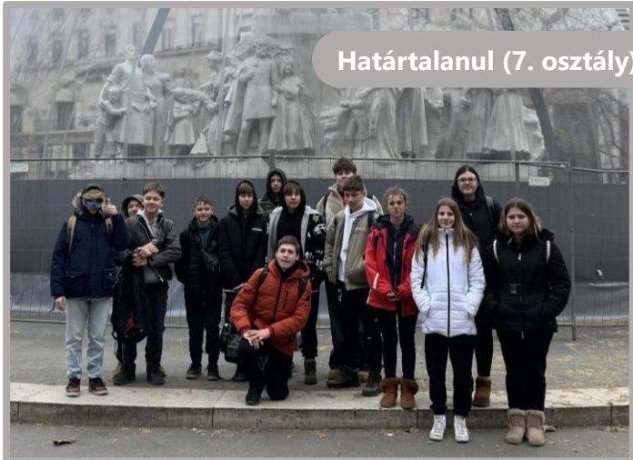
Határtalanul (7. osztály)