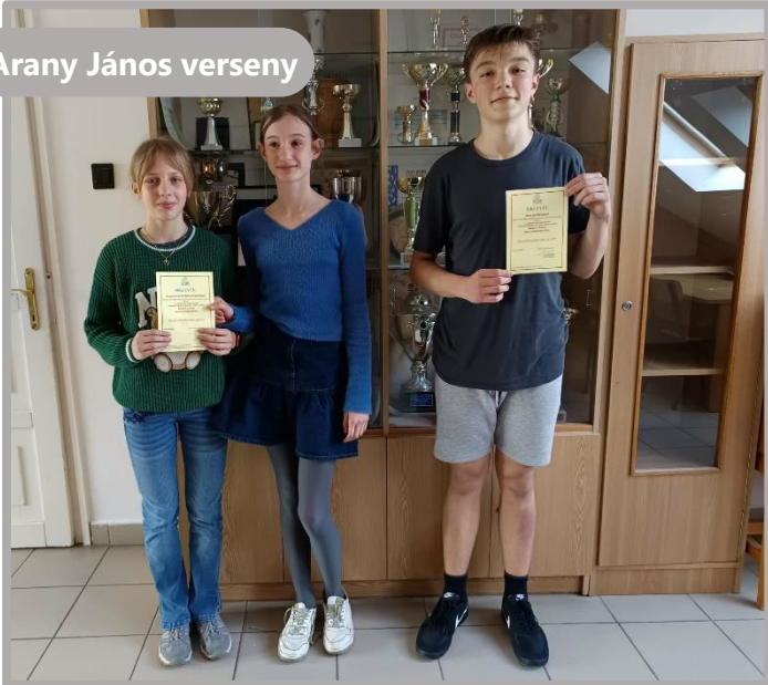
Arany János verseny