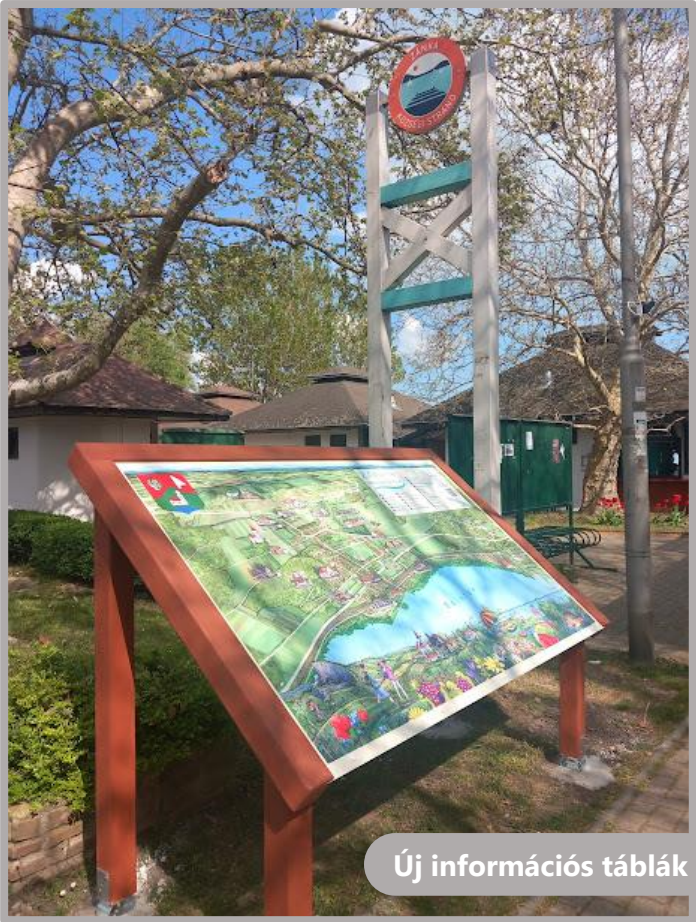
Új információs táblák