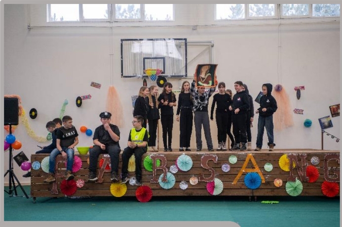
Farsang az iskolában. Balra 1, 2, 3, 4. osztály, jobbra 5, 6, 7, 8. osztály